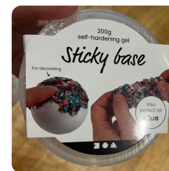
Sticky Base - boetseergel EA3624