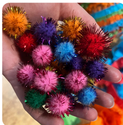
Pompons met glitter RK1910